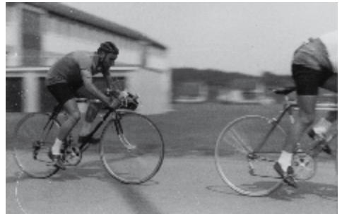
Aschenbahnrennen waren eine Alternative zu den Bahnrennen und konnten von vielen Vereinen auf Sportplätzen ausgerichtet werden

Der Aalener Künstler und Bildhauer Peter Mayer-Asboe, der sich auch als Radrennfahrer versuchte, gestaltete das Vereinslogo in den Farben „orange“ und „violett“. Außerdem legte er die Kleinschreibung des Vereinsnamens fest.