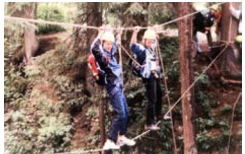
2001: Schluchtüberquerung per Seilsteg im Kleinwalsertal