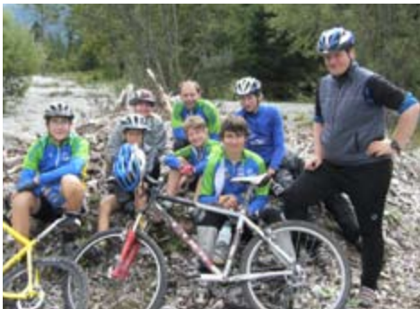
2007: MTB-Jugendfreizeit in Heiterwang