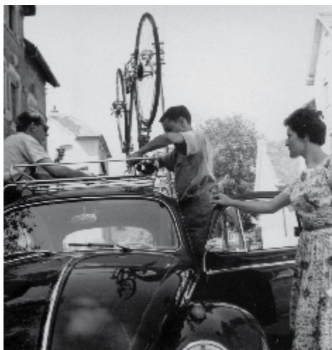
Sonntäglicher Familienausflug zum Radrennen