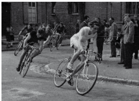
Packende Wettkämpfe in der Innenstadt