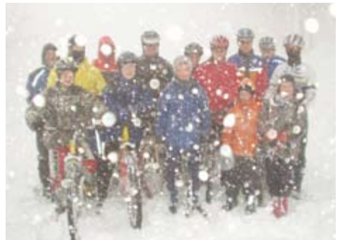
2005: MTB-Trainingslager auf dem verschneiten Brauenberg