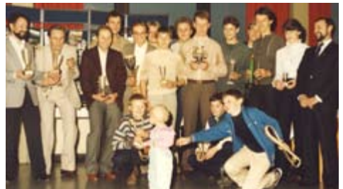
Die Jubilare und Geehrten des rrc bei der 25-Jahr-Feier