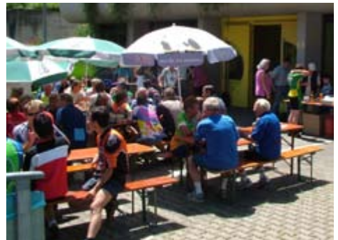
2007: Geselliger Ausklang beim AOK-Radsonntag an der Talschule