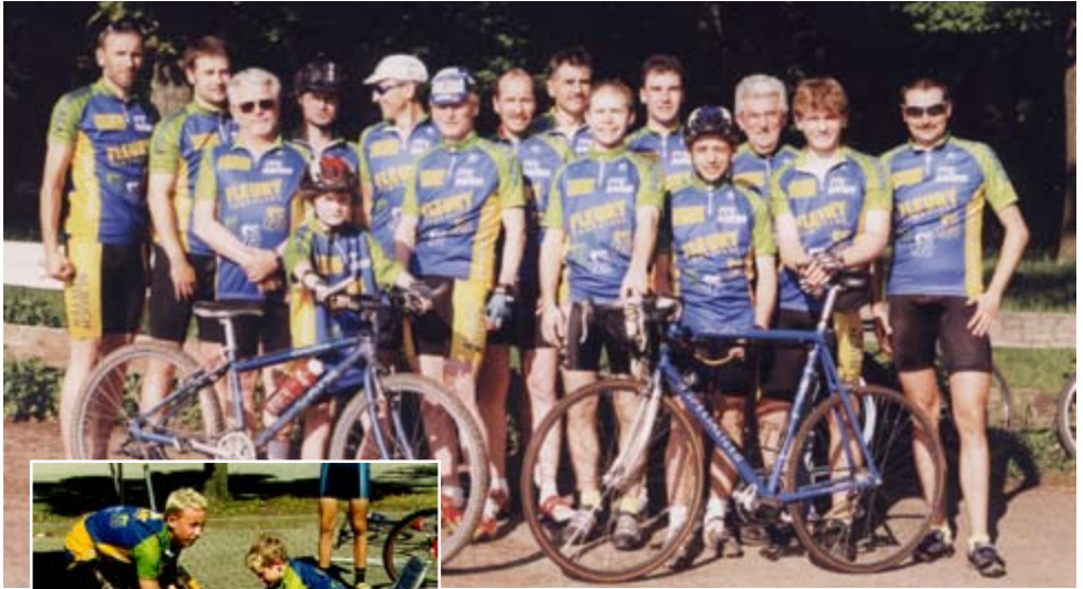
1999: Die neue Teamausstattung des rrc-aalen in den Farben blau, gelb, grün