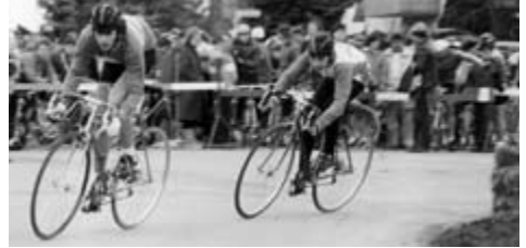
Olaf Wahl (rechts) bei der Verfolgung