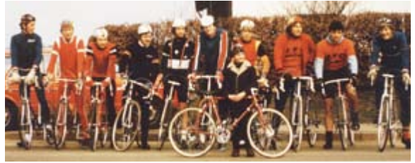
Die Rennfahrer von 1981