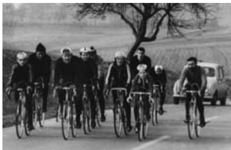
Trainingsausfahrt in den 70ern