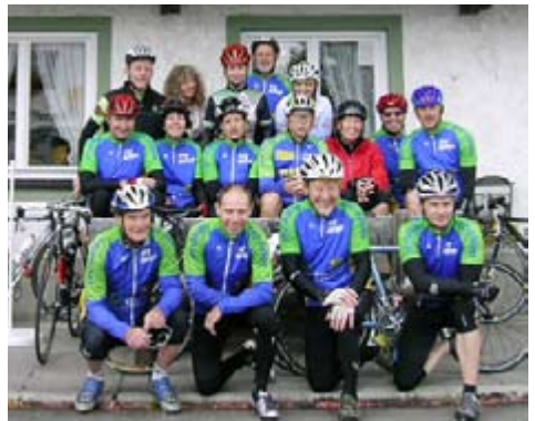
2009: Radwochenende im Voralpenland bei Murnau