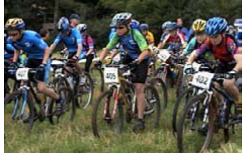
2003: Massenstart beim Aalener-Hirschbach-MTB-Event