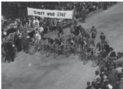
Start zum internationalen Rundstreckenrennen in Aalen