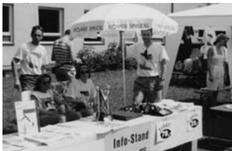
Infostand des rrc-aalen beim AOK Radsonntag 1994