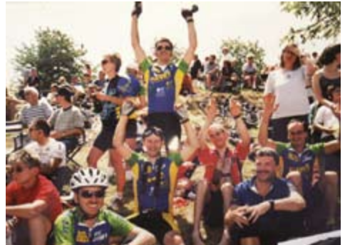
2000: Begeisterung bei der Tour-de-France-Etappe in Freiburg