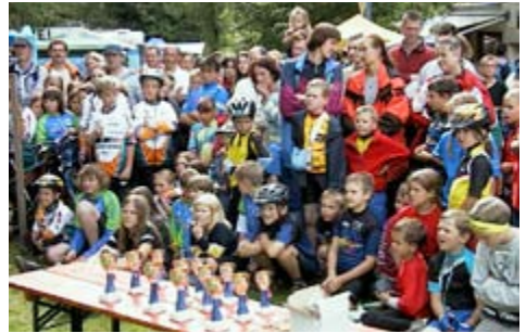
2002: Gespannte Gesichter vor der Siegerehrung des Aalener-Hirschbach-MTB-Events