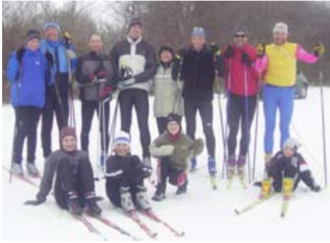
2006: Langlauf- und Skating-Schulung auf dem Härtsfeld