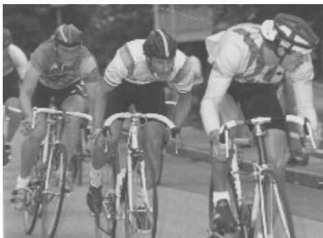
Packende Rennszenen beim Kriterium in Unterrombach