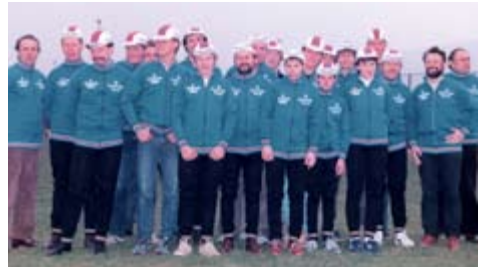
1984: Die Rennmannschaft mit neuen Trainingsanzügen