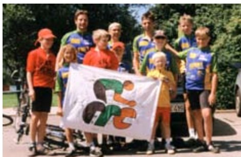
Die rrc-Kids der neu gegründete rrc-Mountainbike-Abteilung