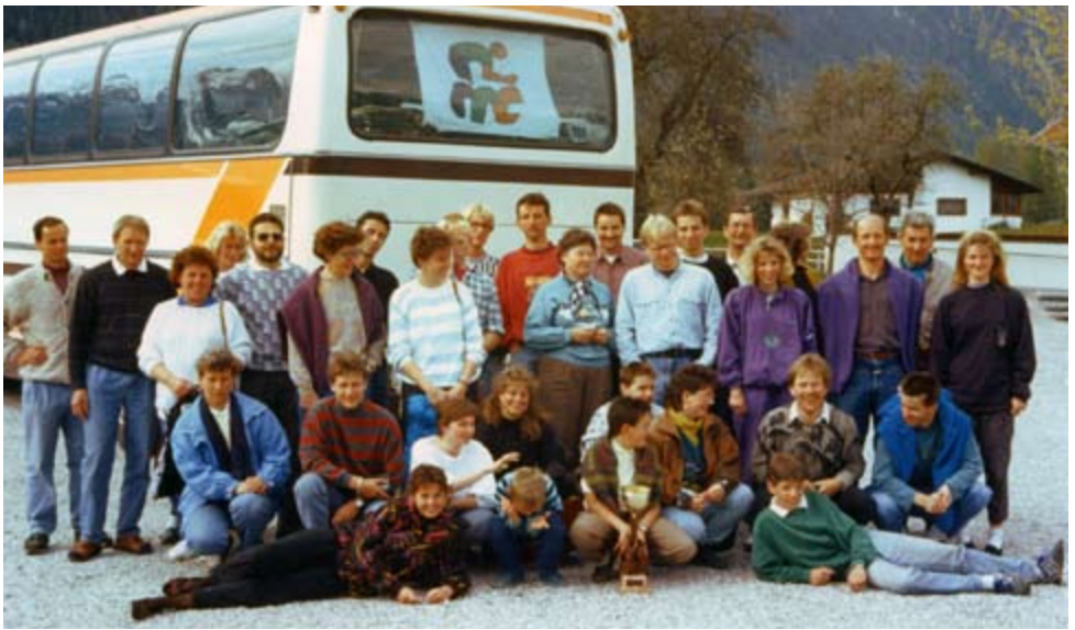
1991: Trainingslager in Cesenatico (bei Rimini, Italien)